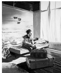
Andy Denzler, Fading Out, 2011, #1969, Öl auf Leinwand, 190 x 160 cm

Zürich — Blinder Aktivismus ist out. In trendigen Galerien werden Yoga-Kurse abgehalten, Vertreter der Slow-Food-Bewegung versammeln sich um stundenlang geschmorte Bio-Haxen, und die Zahl der bekannten «Slobbies» (slo- wer but better working people) steigt. Unserer bunten, lauten Welt setzt der Zürcher Andy Denzler (*1965) sinnierende Menschen oder auch Porträts entgegen. Er malt seine Modelle ganz klassisch, in Öl oder Acryl, Schwarzweiss, Grau, Sepia oder Blau. Die Bildoberflächen durchpflügt er mit einer Rakel, als wären die Bilder verwackelt, verzogen, als hätte man die Stopp- oder Fastforwardtaste eines Videos gedrückt. Jedenfalls erinnern sie an Interferenzen eines Schwarzweiss-Fernsehers aus den Sechzigerjahren. Auch die Gemälde der Serie «The Human Nature Project», 2010, die sich mit der Beziehung von Mensch und Natur auseinandersetzen, wirken wie Stills aus alten Videos. Der Künstler malt nach Medienbildern, Fotografien oder nach Modell. Doch nicht Motiv oder Erzählung stehen im Vordergrund, sondern Fragen der Malerei. Die in ihren Bewegungen scheinbar kurz innehaltenden Figuren sprechen von Denzlers Begeisterung fürs Filmische, während die undefinierbaren, flächigen Hintergründe und die abstrakten, flimmernden Streifen Spuren zu seiner jahrelangen abstrakt-expressionistischen Malweise legen. DvB